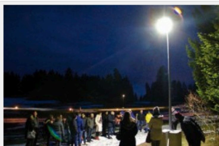
Un des mâts déjà placé et que les élus et intéressés ont pu découvrir, mardi soir, après la présentation technique.

Bullet – L'installation de six lampadaires alimentés par les modules photovoltaïques de la société Solar-Advance représente une première suisse.